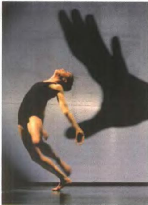
▲ Ο διάσημος Γάλλος χορογράφος Φιλίπ Ντεκουφλέ, που θα εμφανιστεί στο φεστιβάλ χορού Καλαμάτας